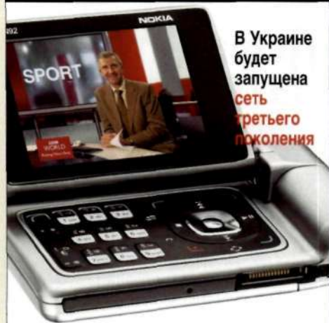
В Украине будет запущена сеть третьего поколения