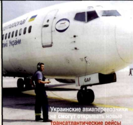
Украинские авиаперевозчики не смогут открывать новые трансатлантические рейсы